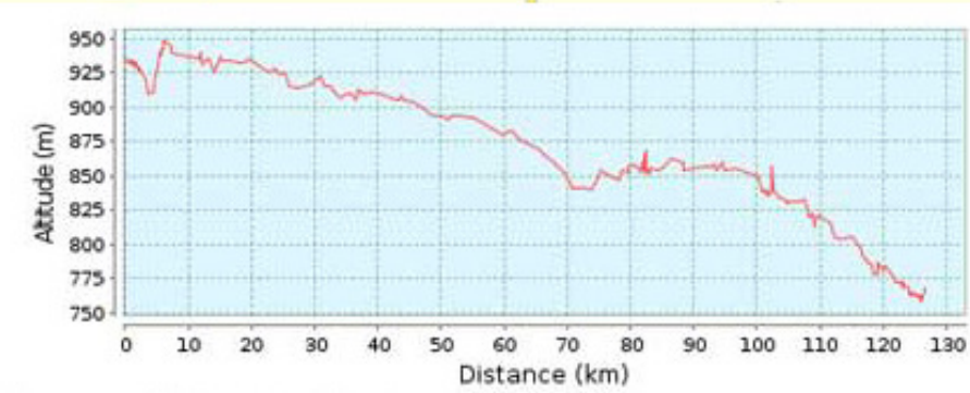
Höhenprofil (758 m bis 948 m)